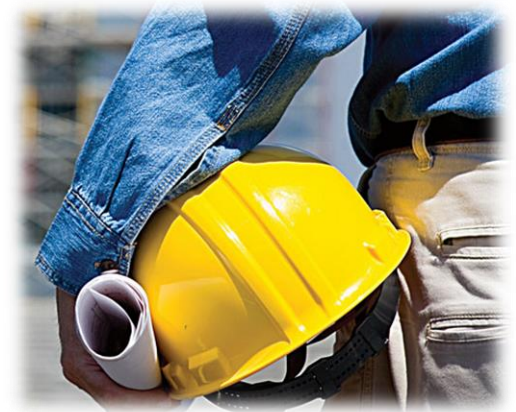
Apoio a Fiscalização