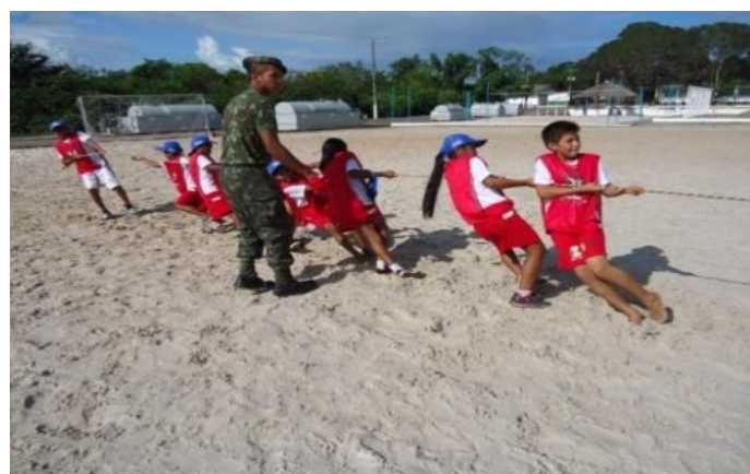
Trabalho em equipe (São Gabriel da Cachoeira/AM)