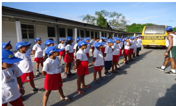
Comunidades indígenas Baré, Tukano e Baniwa (São Gabriel da Cachoeira/AM)