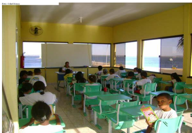
Readequação de instalações para atender o PROFESP – reforço escolar em sala de aula (Palmas/TO)