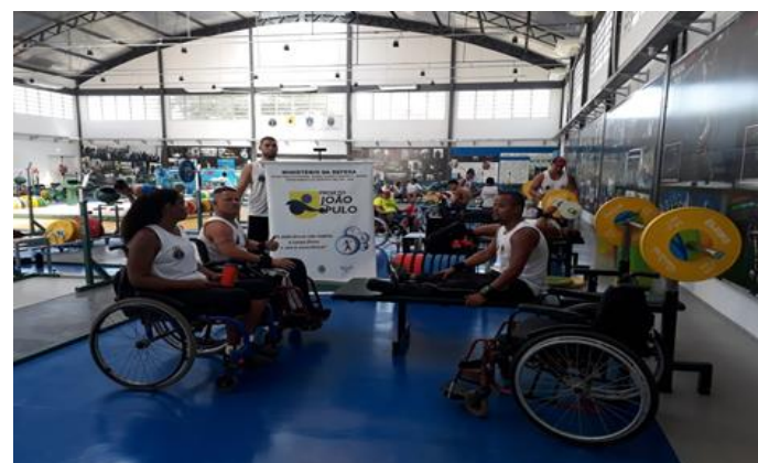
O Projeto João do Pulo na Força Aérea Brasileira (Rio de Janeiro/RJ)