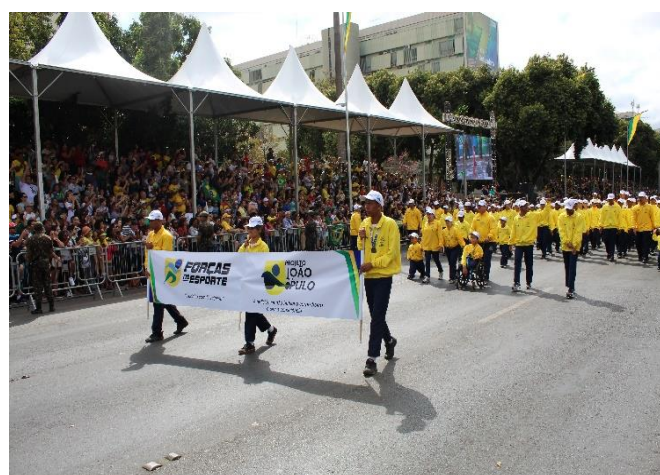
Momento cívico - Dia da Independência (Brasília/DF)