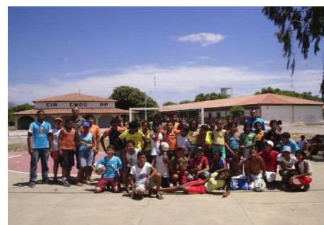
Acesso a várias modalidades esportivas e a integração entre militares e civis (Brasília/DF; Palmas/TO; Tefé/AM)