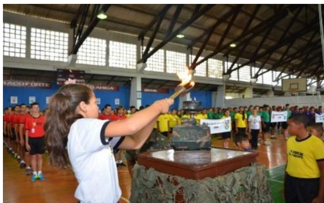
Jogos do PROFESP no RS (Santa Maria/RS)