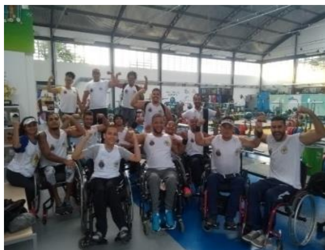
Esporte adaptado (Rio de Janeiro/RJ)