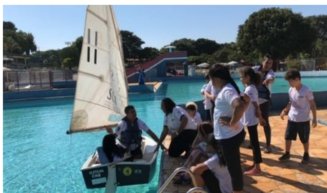
Adoção de soluções criativas para o ensino de modalidades náuticas (Brasília/DF)