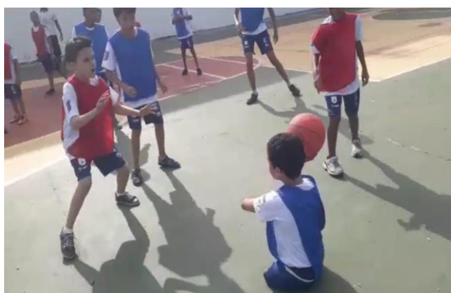
Atividades direcionadas à educação física inclusiva para pessoas com deficiência (Brasília/DF)