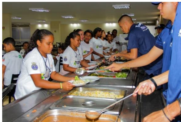
Café da manhã, almoço e lanche - alimentação saudável e reeducação alimentar (Belém/PA e Brasília/DF)