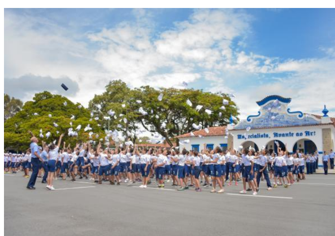
Encerramento das atividades anuais (Guaratinguetá/SP)