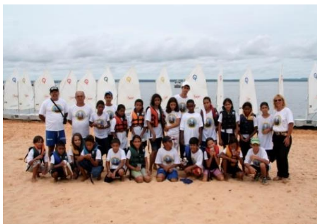
Iniciação à Vela (Palmas/TO)