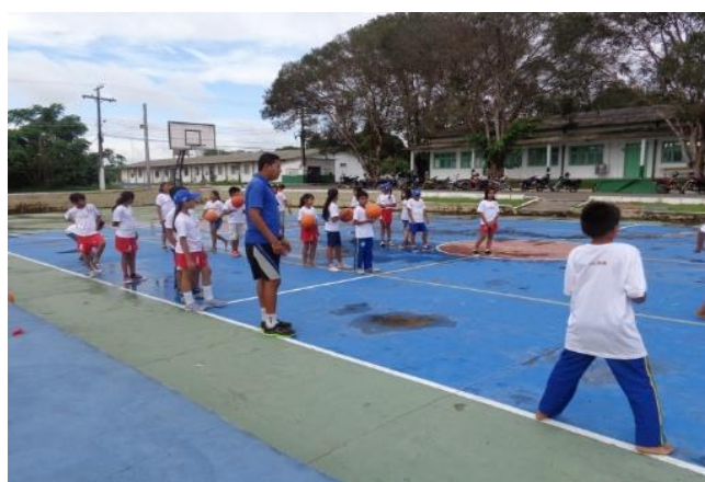
Basquetebol (São Gabriel da Cachoeira/AM)