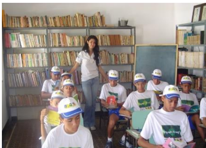
Letramento e cultura (Curitiba/PR)