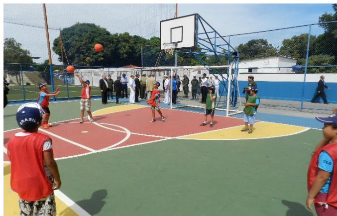
Modalidades com bola: as preferidas pelos alunos (Arraial Cabo/RJ; Manaus/AM)