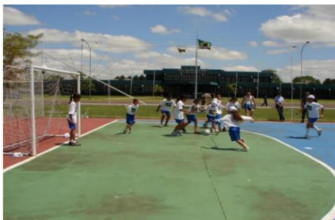
Futebol (Santa Maria/RS)