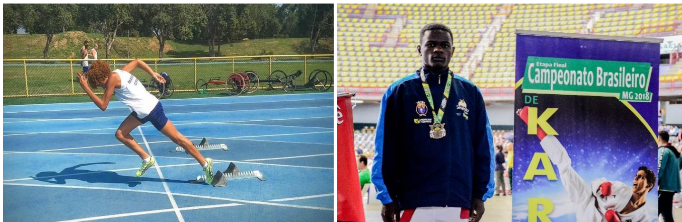
O PROFESP é a esperança de um futuro melhor para nossas crianças (Rio de Janeiro/RJ)