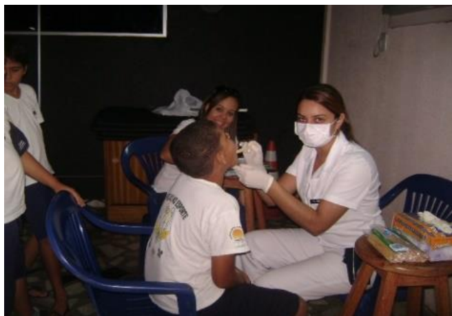
Cuidados com a saúde (Recife/PE)