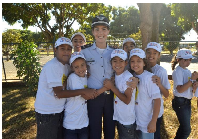
Autoestima, sentimento de pertencimento (Brasília/DF)