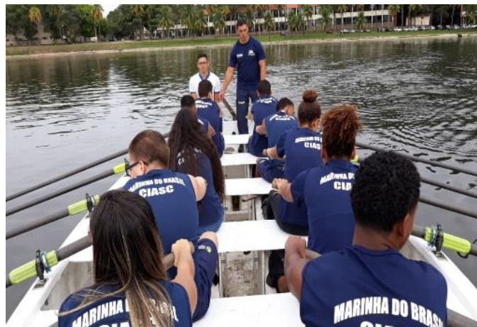
Remo (Rio de Janeiro/RJ)