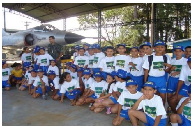
Conhecendo o Brasil: FAB (Anápolis/GO)