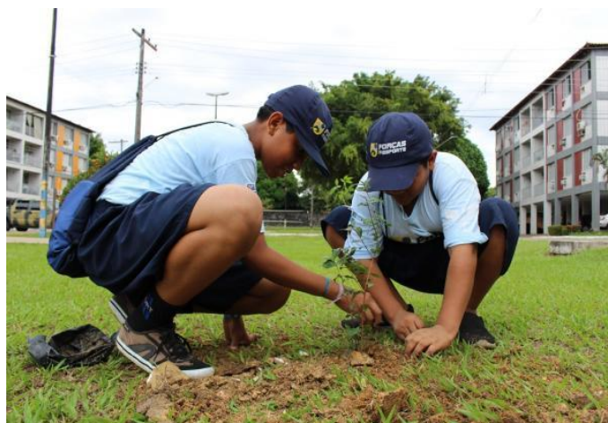
Comprometimento ambiental (Manaus/AM)