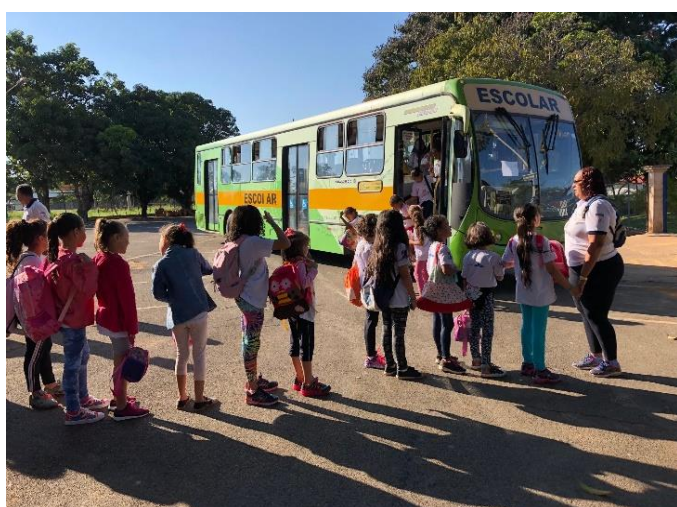
A presença das crianças alegrando os quartéis (Tefé/AM; Palmas/TO)