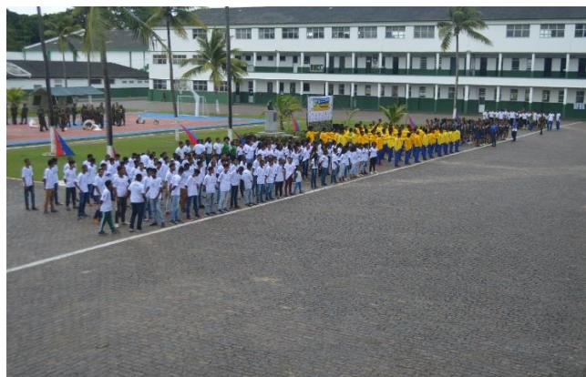
Jogos do PROFESP na Bahia (Salvador/BA)