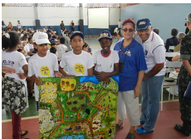
Aulas de reciclagem de materiais - estímulo à criatividade e ao cuidado com o ambiente (Brasília/DF)