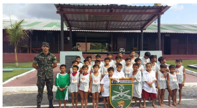
O PROFESP presente em nossos Pelotões Especiais de Fronteiras-PEF (Estirão do Equador, Javari/AC)