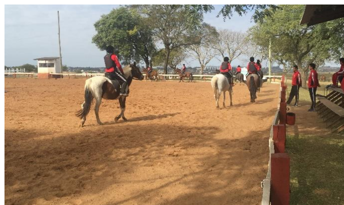
O PROFESP em Organizações Militares de Cavalaria do Exército - Equoterapia e Equitação (Alegrete/RS)