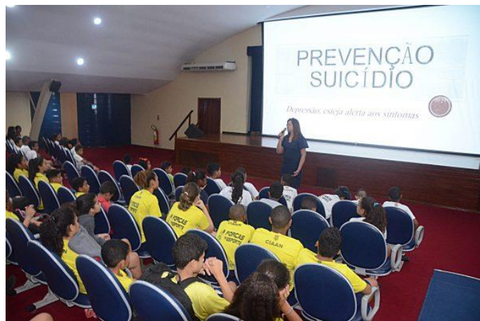
Valorização da vida (RJ)