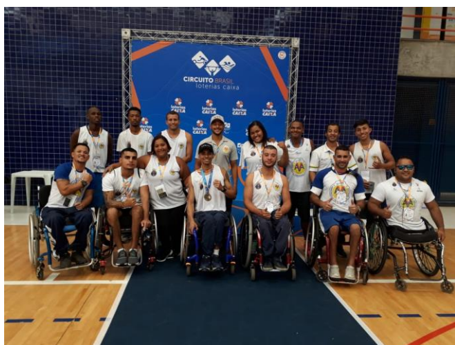
Projeto João do Pulo na Marinha do Brasil e no Exército Brasileiro (Rio de Janeiro/RJ)