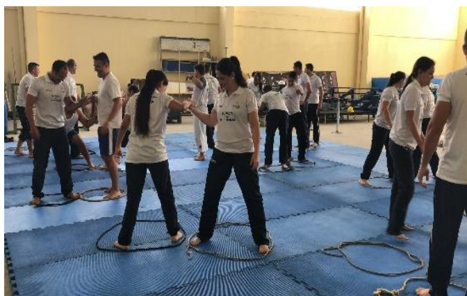
Os professores do PROFESP anualmente realizam uma capacitação pedagógica (Rio de Janeiro/RJ)