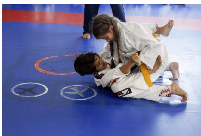
Artes marciais (Curitiba/PR)