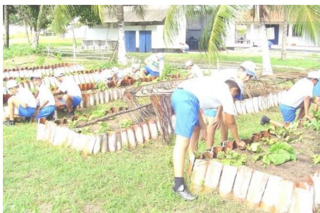
Aprendendo a produzir e a respeitar regras sociais (Belém/PA)