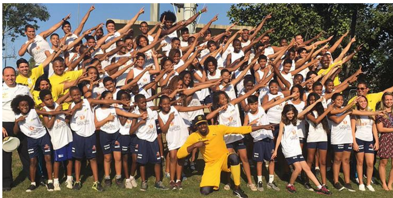
Usain Bolt com os alunos do PROFESP no Centro de Educação Física Almirante Adalberto Nunes (CEFAN/RJ)