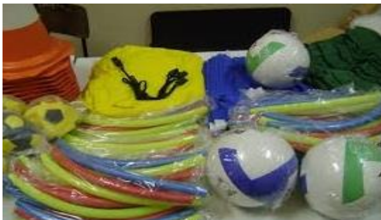
Material esportivo adquirido pelas Organizações Militares