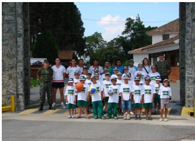
Iniciação desportiva - Basquetebol, Voleibol e Futebol (Blumenau/SC) e Coral (Brasília/DF)

Cada Núcleo é composto, preferencialmente, por 100 crianças , sob a orientação de um coordenador e monitores, que desenvolvem atividades físicas, esportivas, adaptadas, educacionais, culturais, sociais, de cidadania, de segurança alimentar e de revelação de talentos, no contraturno escolar.