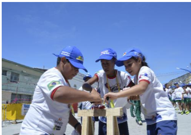
Prova de Orientação - chegada a um dos pontos, as medalhas conquistadas e a carta de orientação (Maceió/AL)