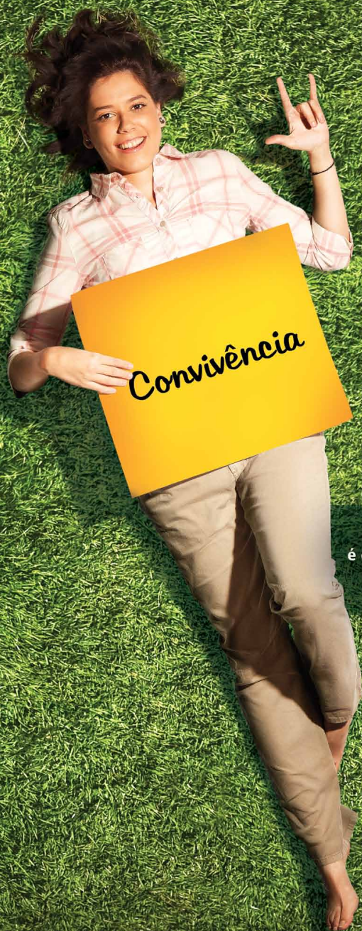
Helenne Sanderson é estudante de design gráfico e tem deficiência auditiva